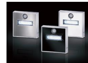
KENNGOTT Stair Light „Aufbau“ B/H/T 80x80x17 mm – inklusive 3 Designblenden