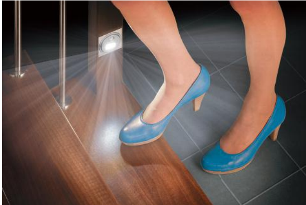
Immer eine optimale Sicht auf der Stufe oder dem Boden

Für mehr Sicherheit auf der Treppe hat KENNGOTT die Stair Light-Treppenbeleuchtung entwickelt.